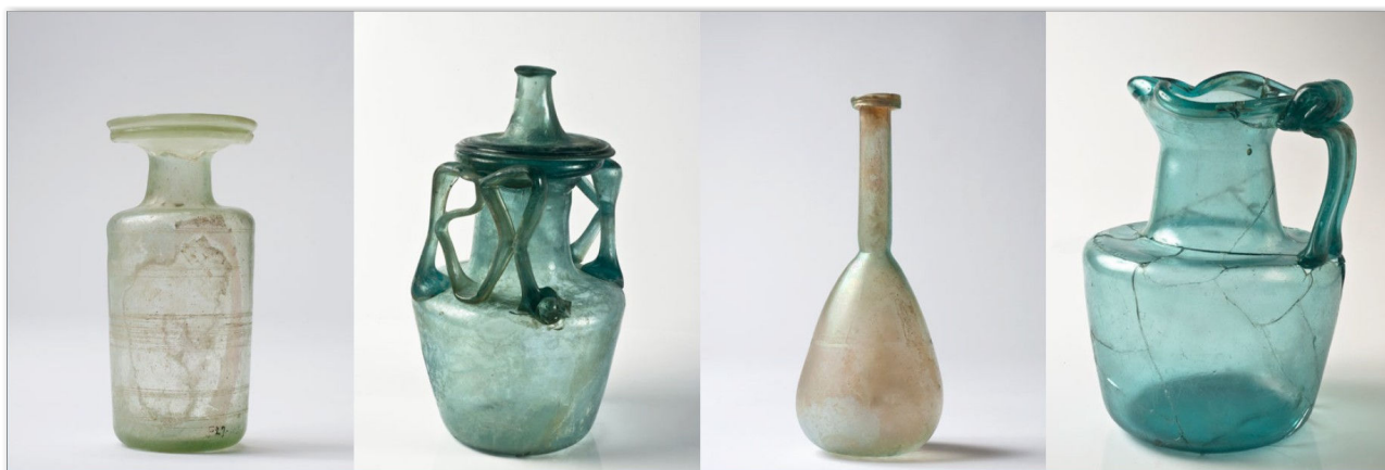
Flacon, Urne, Balsamaire, Oenochoe, verre soufflé, 2e - 4e siècles.