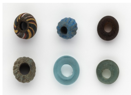
Perles, Saint-Herblain et Rezé, 1er - 2e siècles