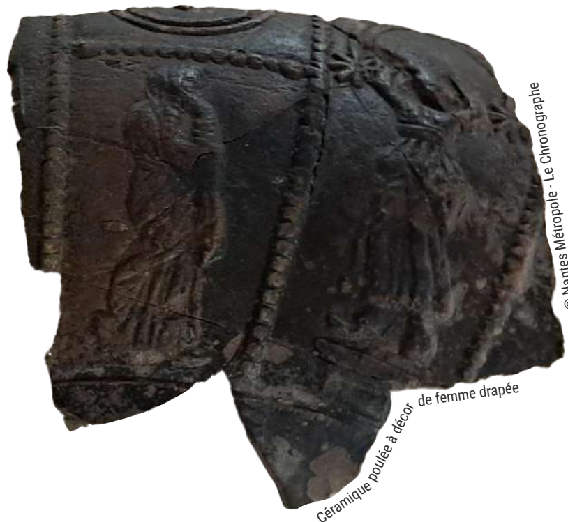
Céramique poulée à décor de femme drapée

Clémence Véran, Passage Sainte-Croix cveran.passage@gmail.com 06 77 12 64 71